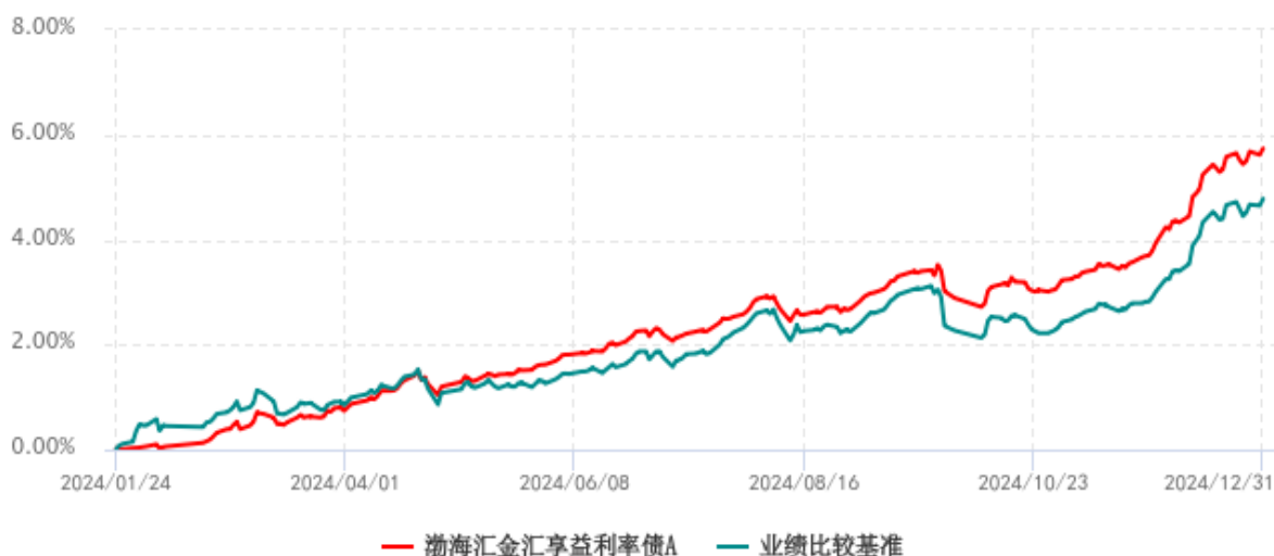
渤海汇金汇享益利率债A累计净值增长率与业绩比较基准收益率历史走势对比图 (2024年01月24日-2024年12月31日)